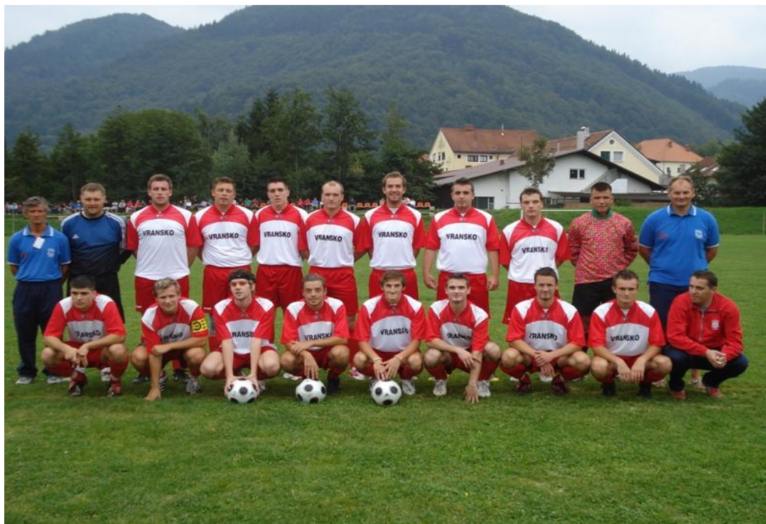
Ekipo članov NK KIV Vransko pred prvo tekmo z NK Žalec

Točen čas tekem bo objavljen na plakatih na oglasnih mestih in na naši spletni strani www.nkvransko.si , kjer si lahko preberete vse najnovejše o delovanju našega kluba. Vse nove člane pa vabimo k vpisu v našo šolo nogometa in sicer vsak ponedeljek in sredo ob 16.00 v prostorih nogometnega kluba Vransko.